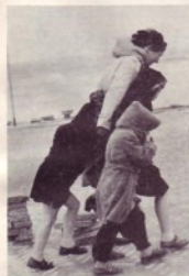
Samen tegenwind trotsend.